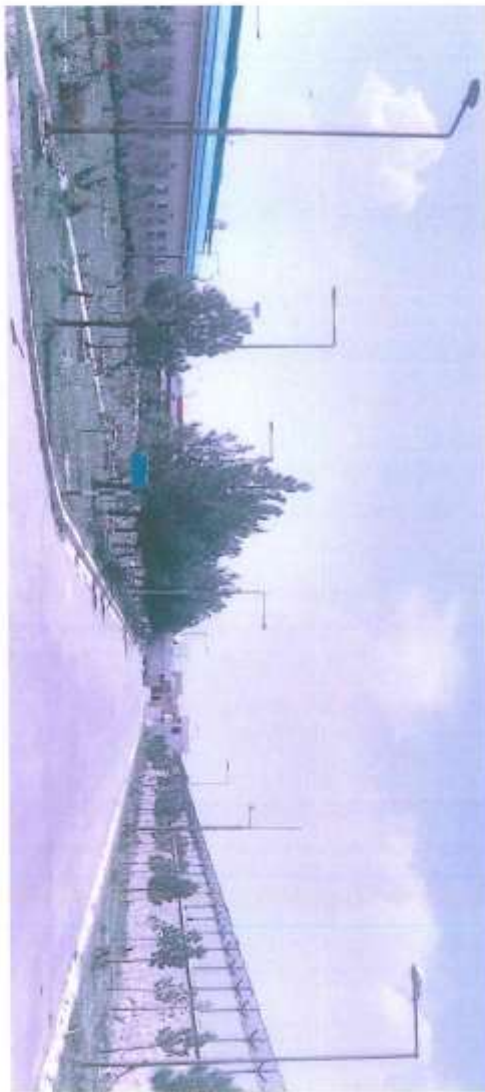
نمونه عکس که محل نصب گروپ ها را واضح میسازد