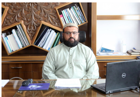
د مالی وزارت یو شمېر ریاستونو ته نوي رئیس وړ معرفي سول