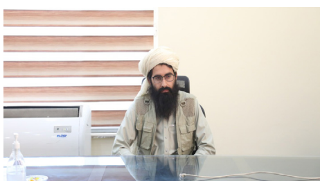
د مالی وزارت یو شمېر ریاستونو ته نوي رئیس وړ معرفي سول