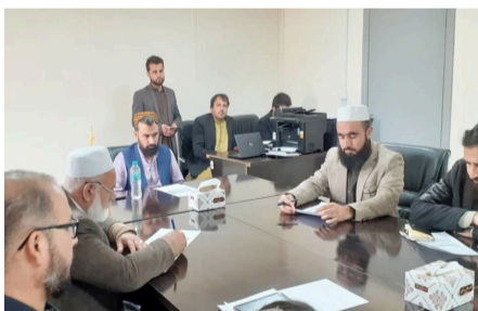
جلسه هیئت مدیره شرکت دولتی آبرسانی و فاضلاب شهری، پلان سال مالی آینده این شرکت را در پرنسیپ مورد تأیید قرار داد