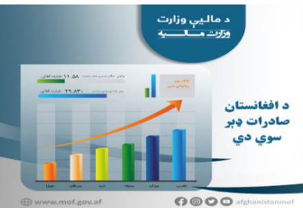
افزایش صادرات افغانستان