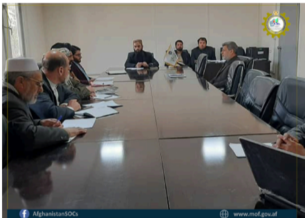
د هلمند بۇست د نباتي غوړيو او پنبې دولتي شرکت د مدیره پلاوي ناسته ترسره سول