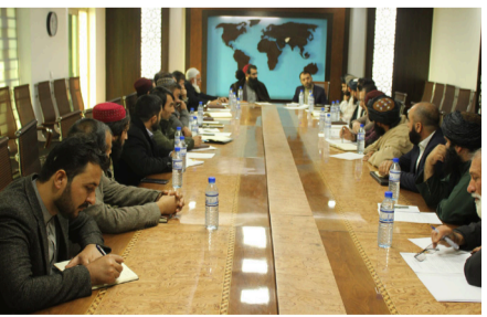
له ولایتي گمرکونو څخه د مالیې وزارت د پلټني لوی ریاست د تللي پلاوي موندني د گمرکونو لوی ریاست له مشرتابه سره شریکي سوې