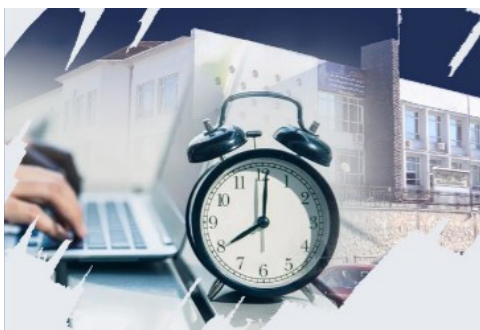
د مالی وزارت یو شمېر مرکزي او ولایتي کارکوونکي په پوره ایماندارۍ تر رسمي وخت اضافه کار کوي