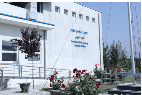
د ګمرکونو او عوایدو ملي اکاډمۍ په ۱۴۰۲ کال کې سلګونه کارکوونکي روزلي دي