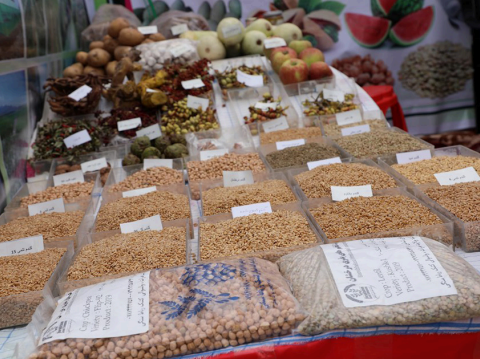
تأسیس زیربنا های اقتصادی و تقویت بنیه مالی و تخنیکي دهاقین برای پروسس محصولات زراعتی