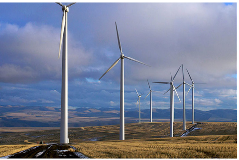
متجددي یا با ثباتی انرژی ته وده ورکول د افغانستان د اقتصادي بیا رغوني لار