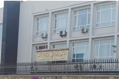
مسئولين جديد وزارت ماليه معرفي گرديدند