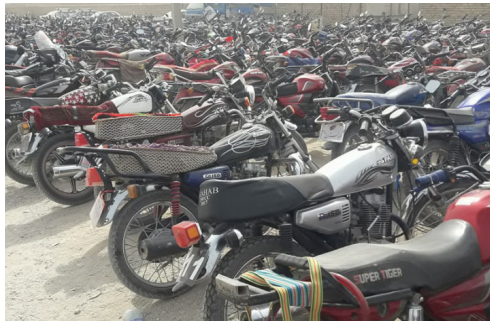
د بې اسناده موټر سایکلونو د ثبت او محصول په تړاو د ګمرکونو لوی ریاست خبرتیا!