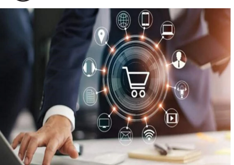
رعایت اصول تدارکات سبز در مراحل تدارکاتی پروژه ها