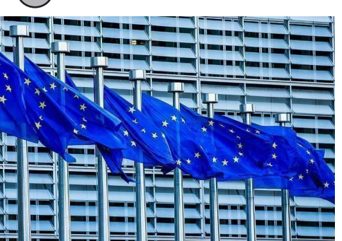
اروپايي اتحاديې د افغانستان لپاره (۱۳) میلیونه یورو مرسته اعلان کړه