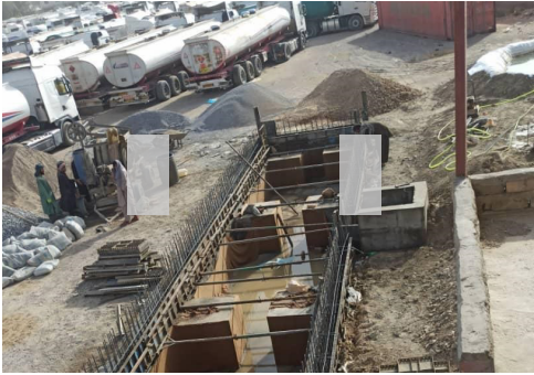
د هیواد په ۴ ګمرکونو کې د لوړ تناژ اخیستلو انلوق ټلي نصبېږي