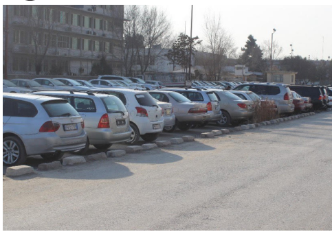
د هیواد په ګمرکونو کې د بې اسناده موټرونو د ثبت او محصول پروسه عملاً روانه ده