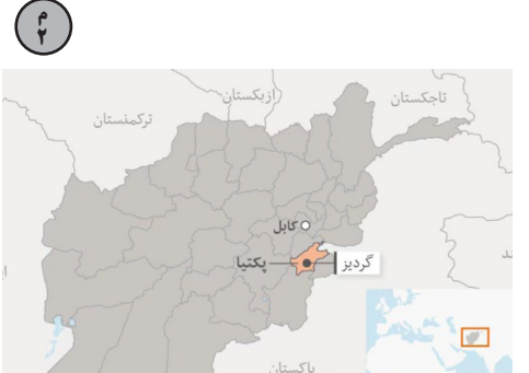
د ډنډ پټان ګمرک کارکوونکو ته (۱۵) ورځنی روزنیز پروگرام پیل سو