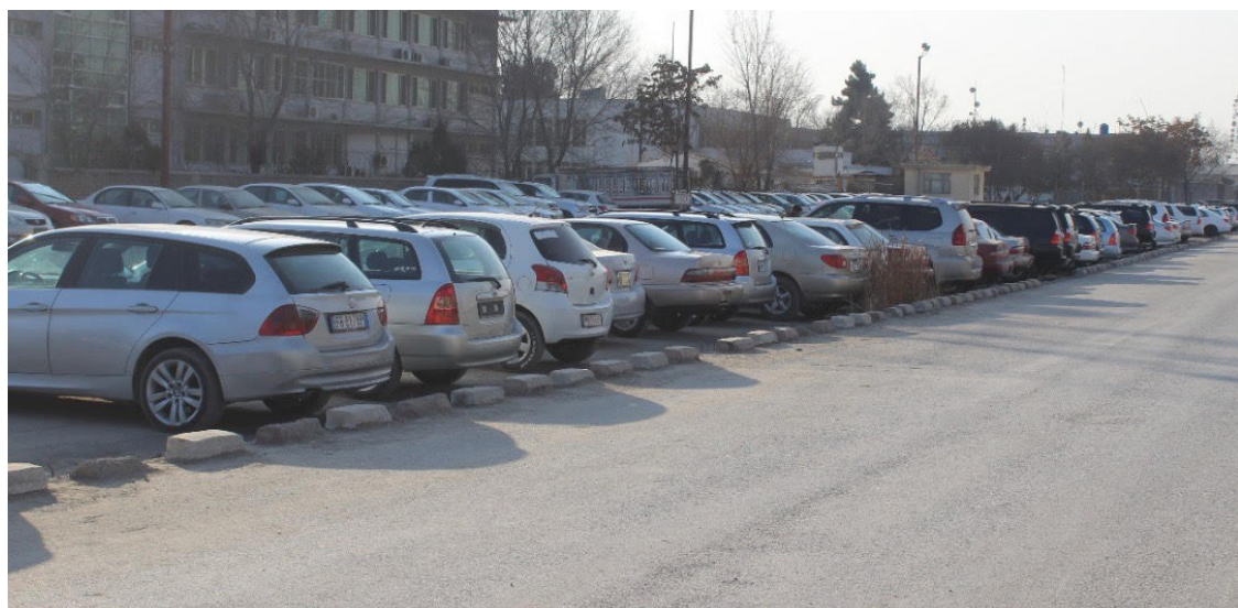
موټرونو له مالکینو څخه غوښتنه کوي، چې له دغه فرصت څخه په ګټه اخیستنې سره خپلو موټرونو ته قانوني اسناد ترلاسه کړي؛ تر څو هم د امنیتي پېښو او هم د عوایدو له تېښتې مخنیوی وسي.

د افغانستان اسلامي امارت د کابینې د پرېکړې او د عالیقدر امیرالمؤمنین (حفظه الله) له حکم سره سم، د افغانستان لاس (یو کیلي) موټرونو د ثبت او محصول پروسه د روان کال تر پایه تمدید او کار نې د هیواد په ګمرکونو کې په عملي ډول روانه ده. د یادي پروسې د چټکتیا په موخه د کاري واحد په نامه د مرکزونو په ګډون ګڼ شمېر اسانتیاوي رامنځته او ټولي پروسې تر یوه چتر لاندې ترسره کېږي. همدارنګه د افغانستان لاس (یو کیلي) موټرونو د ثبت او محصول په پروسه کې د خلکو اقتصادي وضعیت هم په پام کې نیول سوی؛ تر څو د بې اسناده موټرونو مالکان په اسانې سره خپل وسایط محصول کړي. د مالیې وزارت یو ځل بیا د بې اسناده