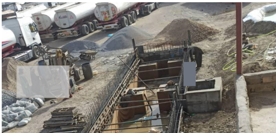
وزارت له پراختیایي بودیجې څخه ورکول کېږي، چې رغیزي چاري به نې به نیردې راتلونکي کې بشپړي سي.

د مالیې وزارت د ګمرکونو لوی ریاست له لوري د هرات، نیمروز، بلخ او آقینې په ګمرکونو کې د (۲۵.۲) میلیونه افغانیو په ارزښت د شپږ پاییو لوړ ټینج (تناژ) لرونکو انلوګ تلو د نصبولو چاري روانې دي. د دغو تلو له جملې څخه دوې پایې د هرات، دوې پایې د بلخ او یوه یوه پایې د نیمروز او آقینې په ګمرکونو کې نصبېږي، چې په فعالېدو سره به نې د سوداګریزو توکو په طی مراحلو کې لا چټکتیا او رویتیا رامنځته سي او د ملي عوایدو له ضایع کېدو څخه د مخنیوي ترڅنګ به پر نویو جوړو سویو سپړونو د زیات وزن لرونکو موټرونو مخنیوی هم وسي. د یادوني وړ ده، چې د یادو تلو ټول لګښت د مالیې