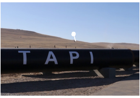
د ټاپي د گازو نللیکه د یوه غټ سراب حیثیت لري