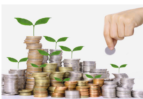
مدیریت و روانشناسی بول