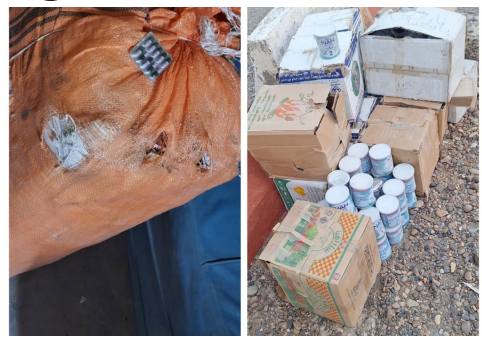
تېره اوونۍ د هيواد په بېلابېلو ولايتونو کي په زياته کچه قاچاقې توکي نيول سوي دي