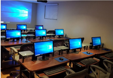
مالي وزارت د مرکزي رياستونو د کارکوونکو لپاره د کمپيوټر زده کړي ابتدايي کورس جوړ سو