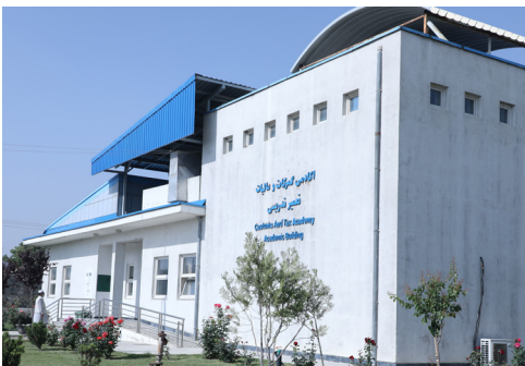
صد تن از محافظين قطعه محافظت و عمليات های خاص تنفيذی وزارت مالیه از پنجمين دوره آموزشی فارغ گردیدند