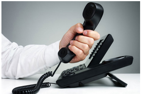
د مالي وزارت مقام د شکایتونو اورېدو خپلواک امریت (۲۰) شکایتونو ته رسېدنه کړې