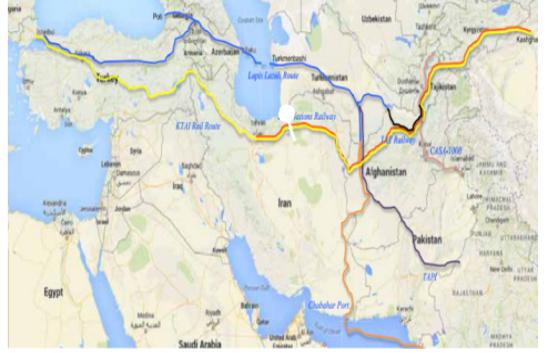
د جين - افغانستان - ايران ټپلۍ د مسير او لگښت د لنډېدو احتمال