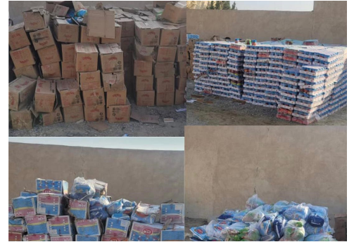
تېره اوونۍ د هيواد په بېلابېلو ولايتونو کي په زياته اندازه قاچاقې توکي نيول سوي دي