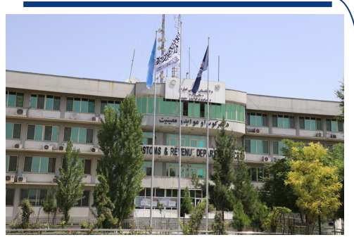
د گمرکونو او عوایدو معین د نفتي موادو د ارزونې په موخه فراه ولایت ته سفر وکړ