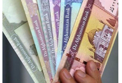
د پيسو د ارزښت ساتل او پياوړتيا