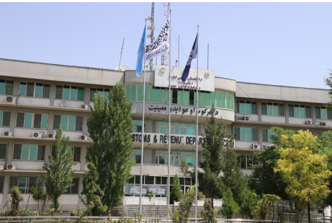
د گمرکونو او عوایدو معینیت د اړوندو ریاستونو ترمنځ د همغږۍ ناسته جوړه سوه