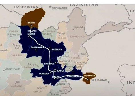
روسیه او ازبکستان د تیرانس - افغان اورگاوي د پروژې په لومړنیو چارو پسې دي