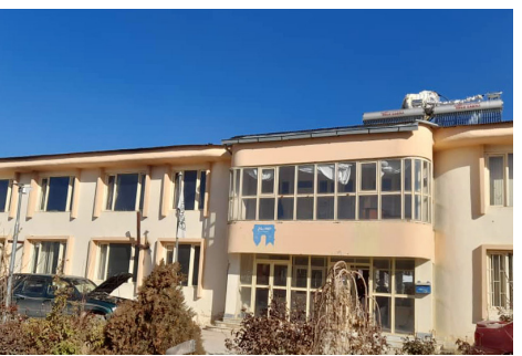
د کورنۍ پلټنې لوی رئیس او ورسره مل پلاوي بامیان ولایت ته سفر وکړ