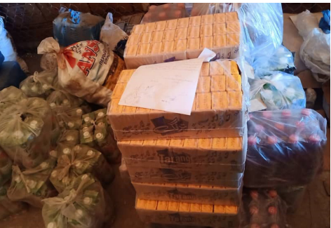
تېره اوونۍ د هیواد په بېلابېلو ولایتونو کې په زیاته اندازه قاچاقي توکي نیول سوې دي