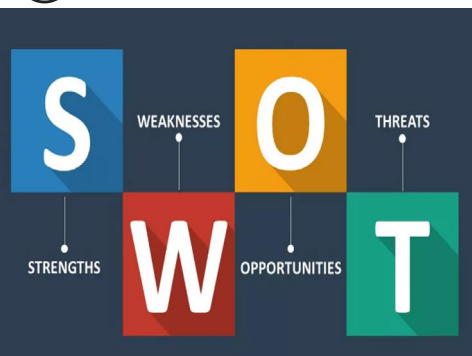
کاربرد SWOT Analysis در مدیریت