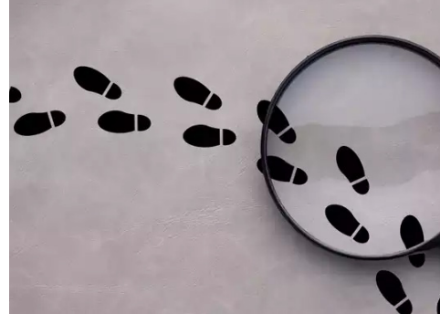
تقتیش مؤثر و اهمیت آن