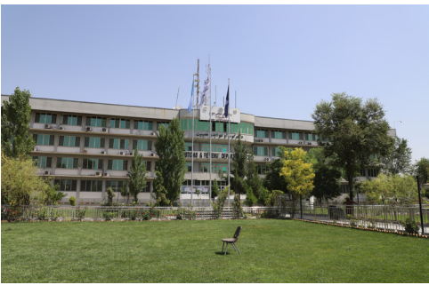
د گمرکونو او عوایدو معینیت د اړوندو ریاستونو تر منځ د همغږۍ ناسته وسوه