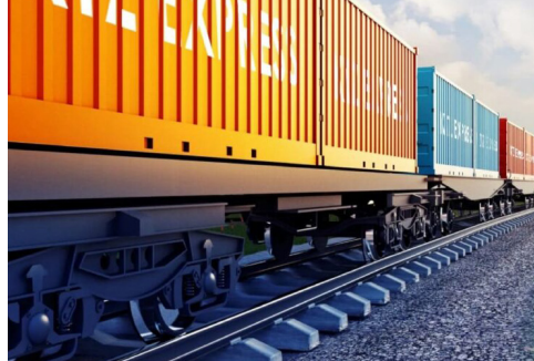
د «پرانس - افغان» دهلېزه په تړاو د قزاقستان هڅه