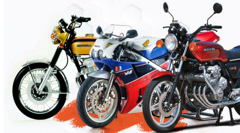
د غزني ولایت په مسئولیت کې د بې اسناده موټر سایکلونو د ثبت او محصول پروسه پیل سو