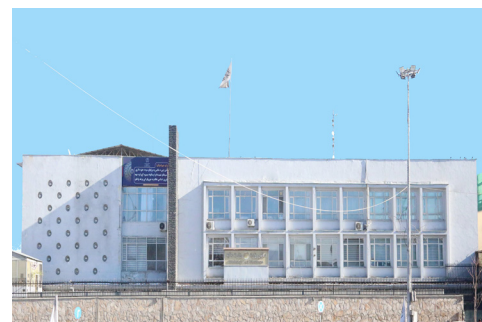
د سویل او سویل لوېدیځ زون د مسئولیتونو او گمرکونو نویو کومارل سویو کارکوونکو ته پر لیکه روزنیز پروگرام جوړ سو

د مالی وزیر الحاج ملا محمد ناصر اخوند، د خپلو رسمي ولایتي سفرونو په لړ کې، د دغه وزارت د مالی او اداري سلاکار او د عوایدو لوی ریاست د حقوقی خدمتونو او پالیسی د رئیس په ملتیا ننگرهار، لغمان او کونړ ولایتونو ته سفر وکړ. نوموړي، د دغه سفر په لړ کې د یادو ولایتونو له مسئولینو او هلته د ملي بانک، نوي کابل بانک او پښتني بانک د ولایتي څانګو له چارو څخه لیدنه وکړه او د عوایدو راتولولو بهیر، په لګښتونو کې د سپما اصل په پام کې نیول او د بانکي خدمتونو چارې له نږدې ارزولې او د چارو د لا ښه والي په موخه یې مسئولینو ته لازمي سپارښتې هم وکړې.