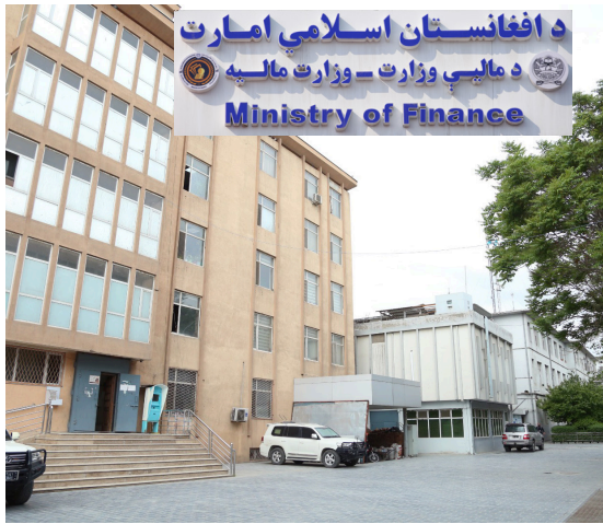
د افغانستان اسلامي امارت د ماليې وزارت - وزارت مالیه Ministry of Finance

راپورونو، د ځينو جايدادونو د کړايې کمولو، د بهرنيو مجلسونو د راپور ورکولو او يو شمېر نورو موضوعاتو په تړاو هر اړخيز بحث او اړيني پرېکړې وشوې. همداراز اړوندو رياستونو شته ستونزې او وړانديزونه هم شريک کړل، چې د رهبرۍ له لوري ورته د پر وخت رسېدو ډاډ ورکړل شو. د يادونې وړ ده، چې د ماليې وزارت اداري معيښت د رهبرۍ ناستې د چارو د لا ښه والي او اغېزمنتوب په موخه ترسره کېږي، چې دغه لړۍ به په راتلونکي کې هم دوام ومومي.